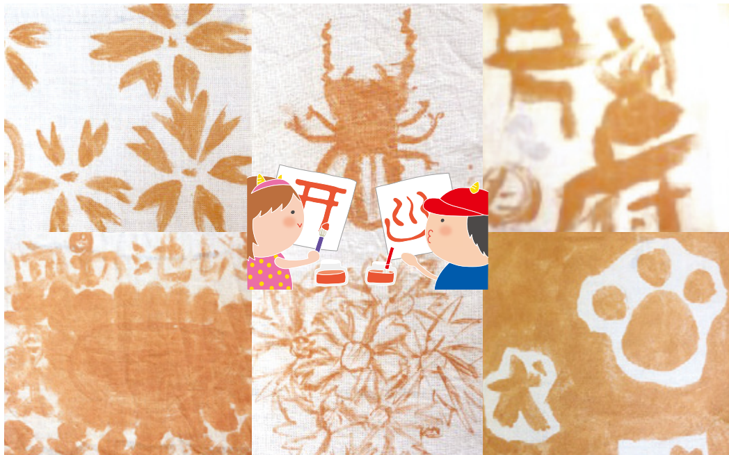
別府市立鶴見小学校3年生が血の池地獄の赤い泥で絵を描きました。