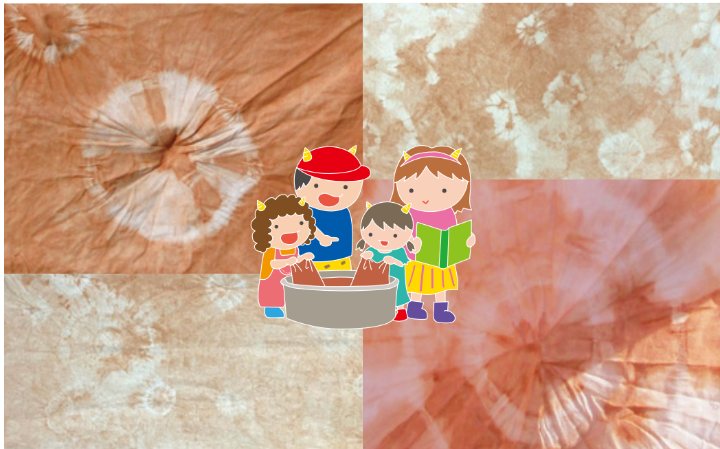
別府大学明星幼稚園5歳児が血の池地獄の赤い泥で絞り染めをしました。