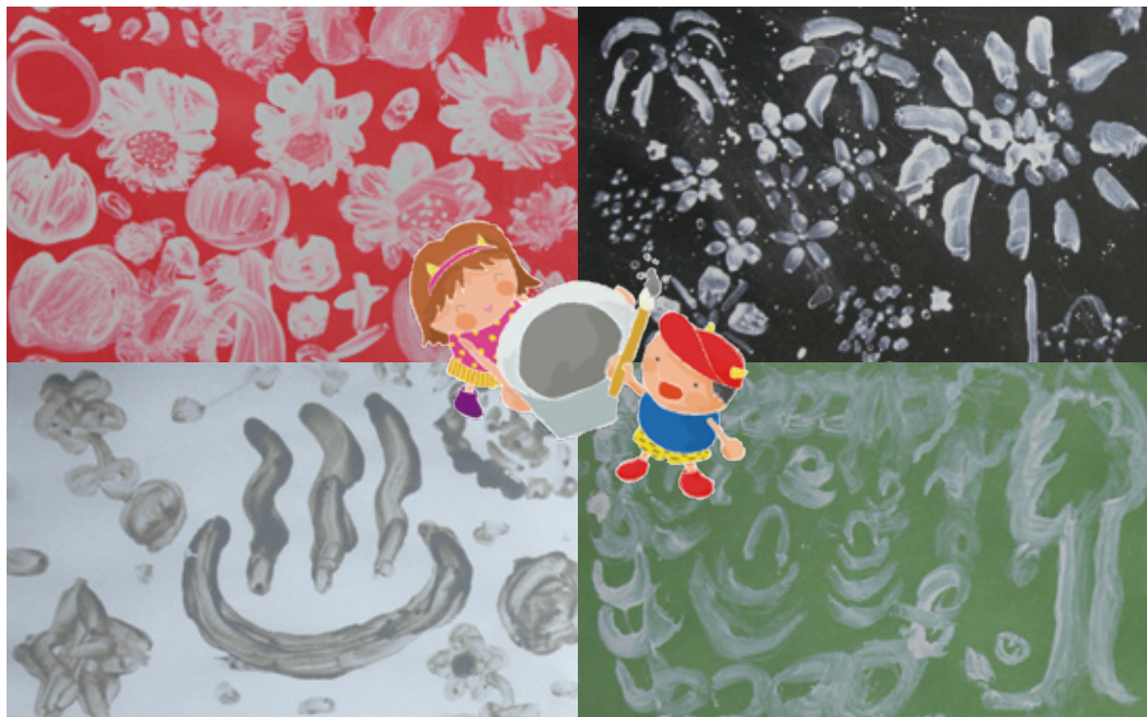
別府市立鶴見小学校3年生が鬼石坊主地獄の泥で色紙に絵を描きました。