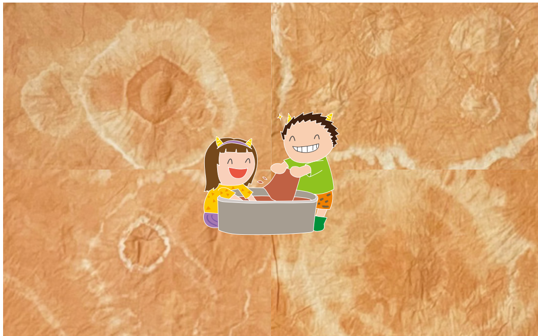
国東市立安岐中央小学校5年生が血の池地獄の赤い泥で絞り染めをしました。